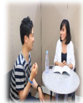
マンツーマン クラスルーム