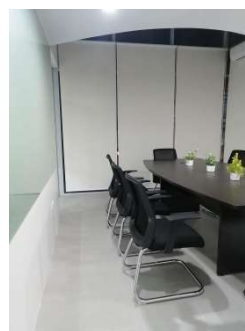
ミーティングルーム②