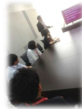
リアルミーティング