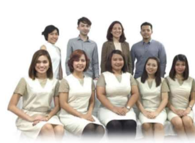
ビジネス英語講師陣

事前のオンラインによる事前テストに基づきカリキュラムを決定された後、毎週金曜日にカウンセリングを実施し、各生徒様のご要望や進捗度に応じて個別にカリキュラムをカスタマイズいたします。