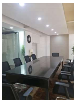
ミーティングルーム①