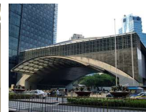
証券取引所 Philippine Stock Exchange (PSE)