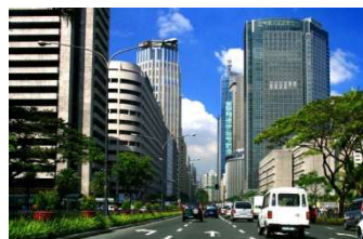
メインストリート Ayala Avenue