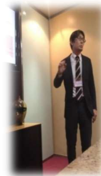
プレゼンテーション