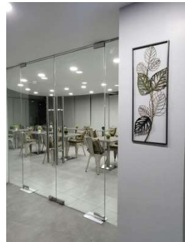
ファンクションルーム