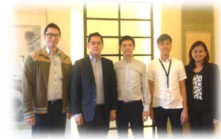
現地企業とのリアルミーティング