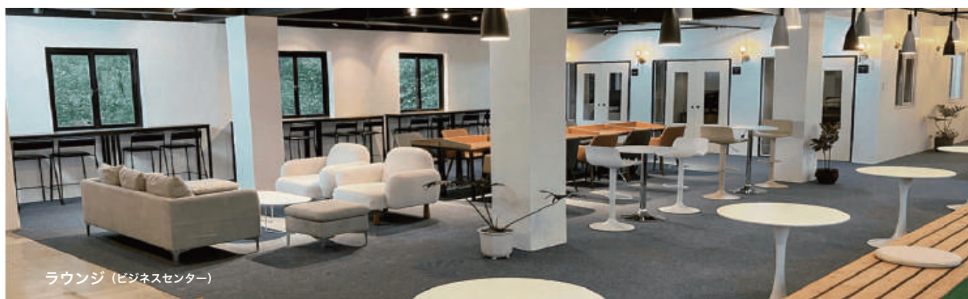
ラウンジ (ビジネスセンター)