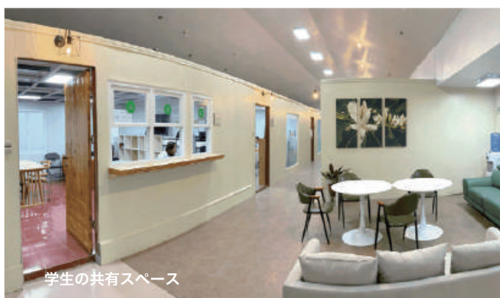
学生の共有スペース