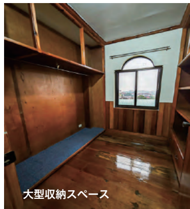
大型収納スペース