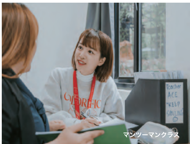
マンツーマンクラス