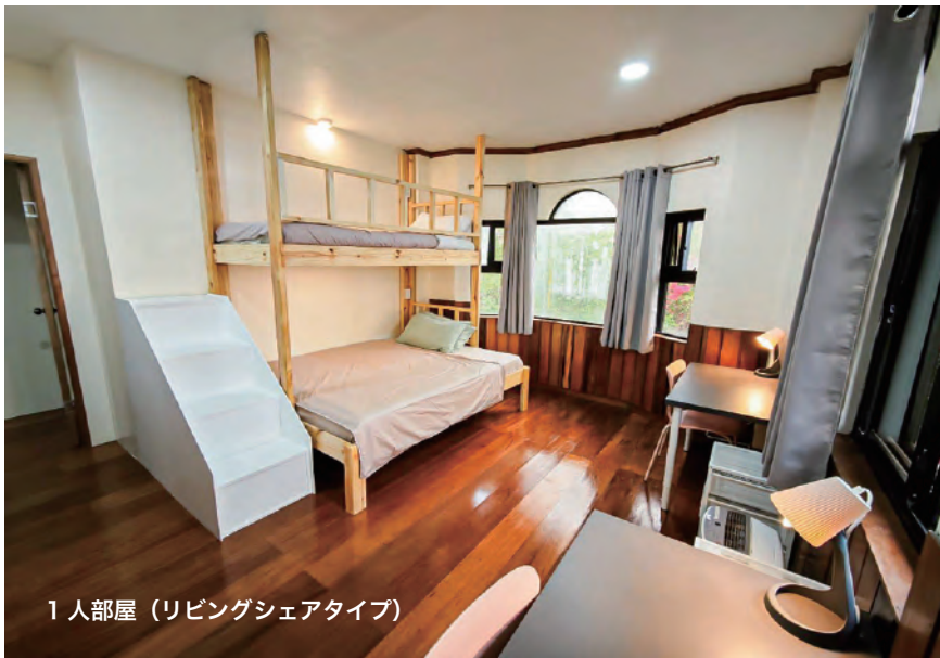
1人部屋 (リビングシェアタイプ)