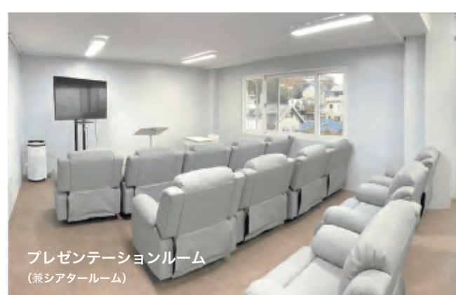
プレゼンテーションルーム (兼シアタールーム)