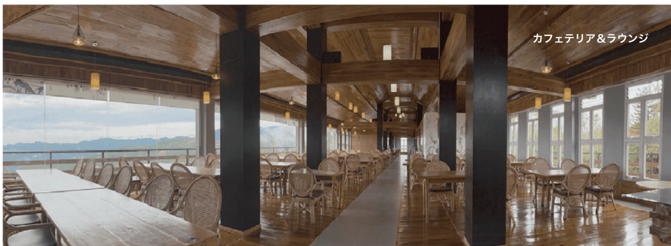
カフェテリア&ラウンジ