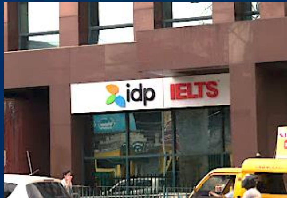
IDP Main TEST Center