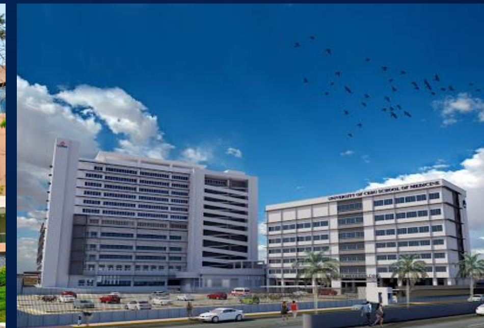
UCEMED & CHONGHUA