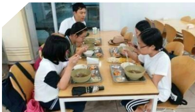
8 夕食 <18:00>