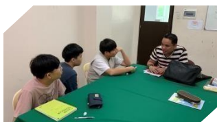
グループクラス <14:00 ~ 16:00>