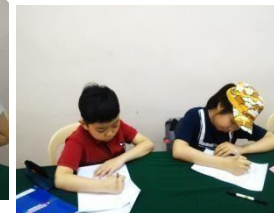
9 宿題 <19:00~>