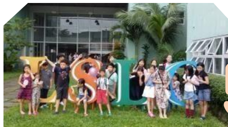
学校キャンパスと 市内ツアー