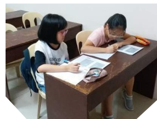
レベルチェックテスト と面談