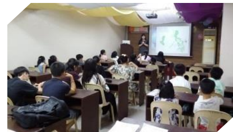
子供たちと保護者のための オリエンテーション