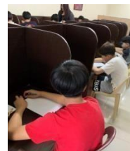
10 <20:00~> 復習・テスト