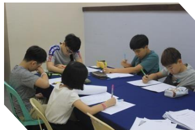
<08:00~ 自習時間 >