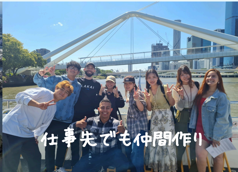
仕事先でも仲間作り