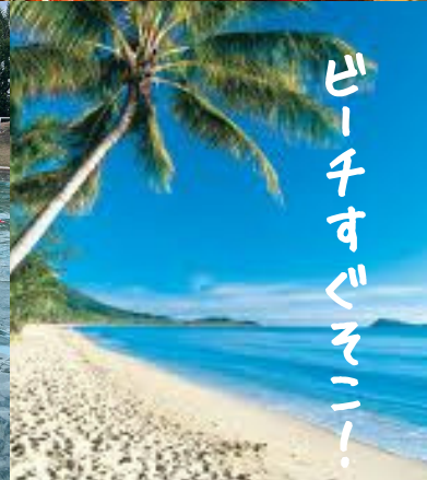
ビーチすぐそばー!