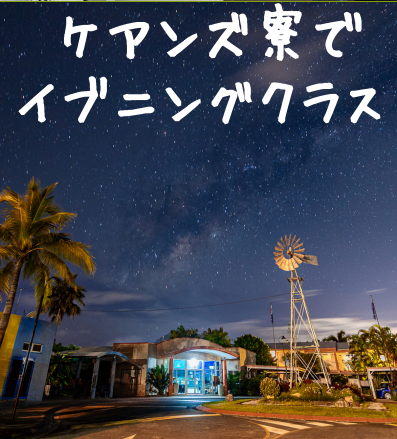
ケアンズ寮でイブニングクラス