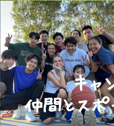
キャンパス内仲間とスポーツで楽しむ!