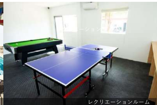
レクリエーションルーム