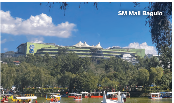
SM Mall Baguio