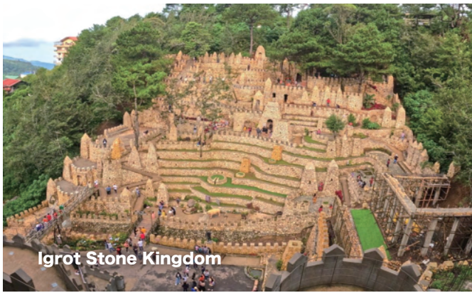
Igrot Stone Kingdom