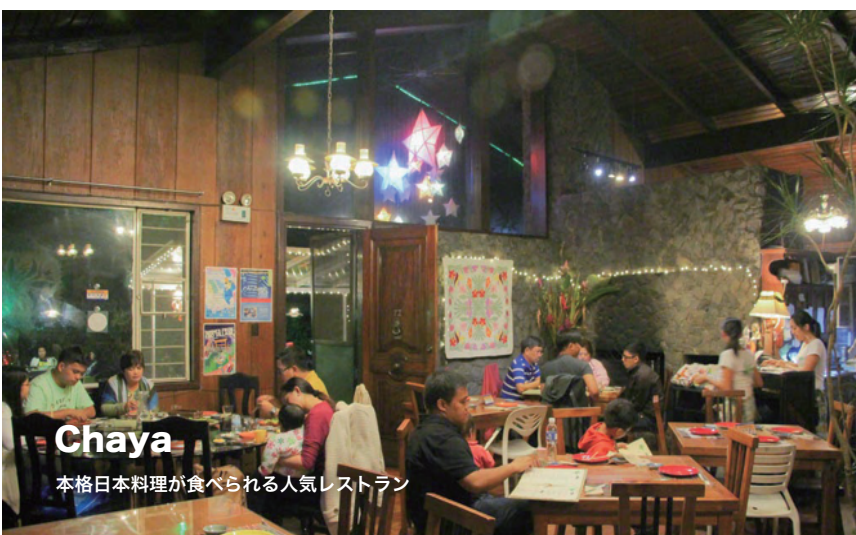
Chaya 本格日本料理が食べられる人気レストラン