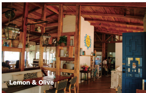
Lemon & Olive