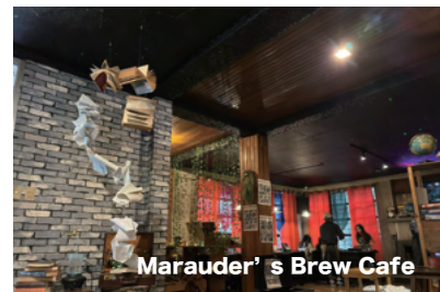
Marauder's Brew Cafe