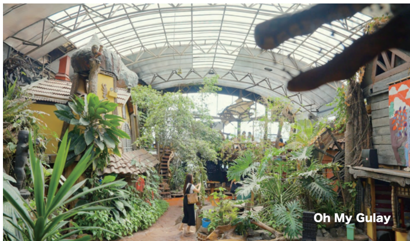
Oh My Gulay