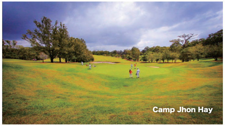
Camp Jhon Hay