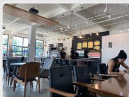
本格コーヒーを飲みたいならここ!