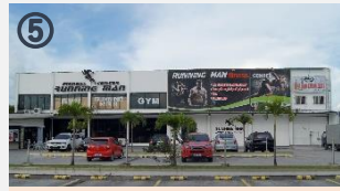
⑤ 徒歩15分の本格フィットネスジム