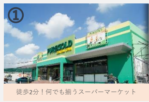
① 徒歩2分!何でも揃うスーパーマーケット

トライシクル/60-80pesos ジブニー/10pesos + 10pesos(NEPO MALL乗り換え) ジブニーの色: 黄色 行先: VILLA PAMPANG