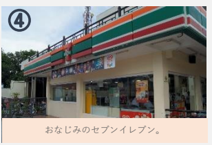
④ おなじみのセブンイレブン。