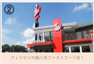
② フィリピンの超人気ファストフード店!