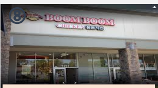
⑧ 徒歩圏内で韓国料理を堪能できます!