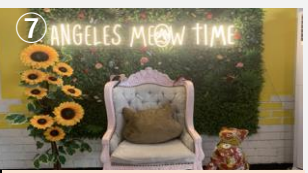
⑦ 可愛い猫ちゃんが待っています♡