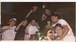
⑧ お別れ会はフィリピン料理で。