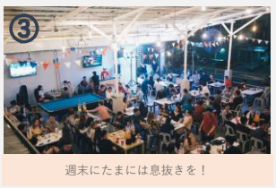
③ 週末にたまには息抜きを!