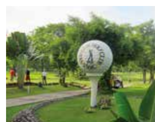
Veterans Golf Club

4th Floor Claretian Communication Bldg, #8 Mayumi St. UP Village Diliman, Quezon City, Metro Manila