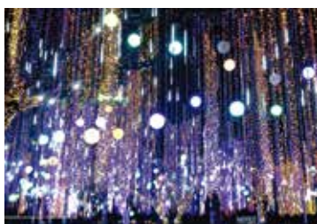
Ayala Triangle Gardens

フィリピンは世界で三番目に英語が話されている国です。小学校から英語で授業がおこなわれており、官公庁やTV・ラジオ放送もほとんどが英語。滞在中のコミュニケーションも英語漬け環境で、授業以外でもレベルアップが期待できます。