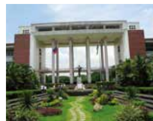
University of the Philippines