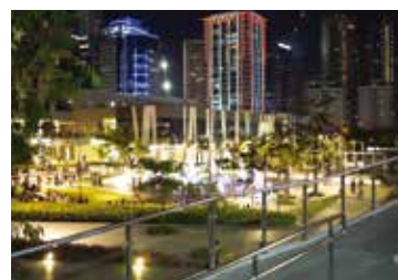
Bonifacio Global City High Street