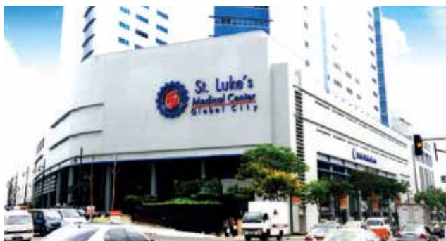
St. Luke's Medical Center - Global City