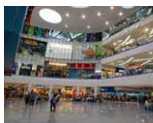
SM Shopping Mall