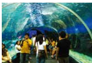
Manila Ocean Park

マンツーマンレッスンの絶対的な会話量は学習効果抜群です。フィリピンの物価は欧米に比べて1/3から1/5と安価で、高品質なレッスンを存分に受けることができます。また日用品をはじめ、ショッピングやグルメ、映画、観光なども格安で楽しめます。