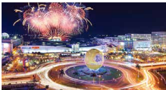
SM Mall of Asia