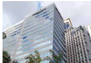
Accenture Eastwood City